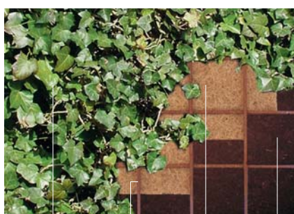
Hedera Treillis en acier Nattes en coco Terre végétale

Web www.quicksetgreen.com Email info@quicksetgreen.com