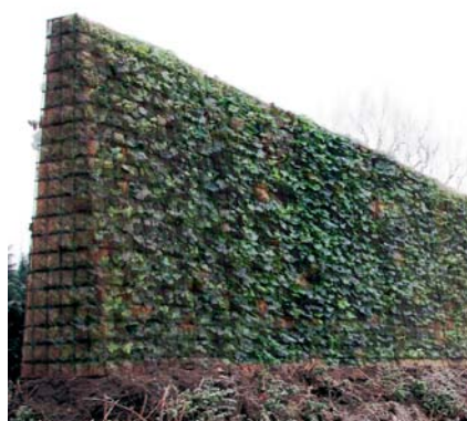
Le Greenwall® après une année